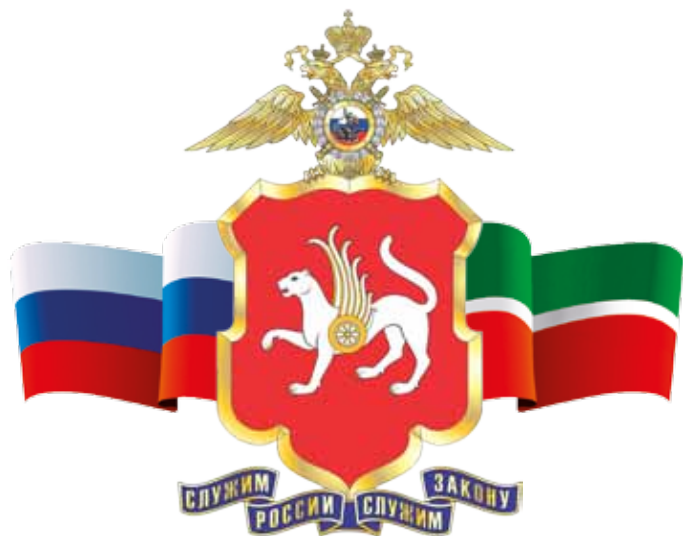
МВД по Республике Татарстан

ЕСЛИ ВЫ ПОДОЗРЕВАЕТЕ, ЧТО ВАС ХОТЯТ ОБМАНУТЬ, СРОЧНО ЗВОНИТЕ В ПОЛИЦИЮ! ВАМ ОБЯЗАТЕЛЬНО ПОМОГУТ!